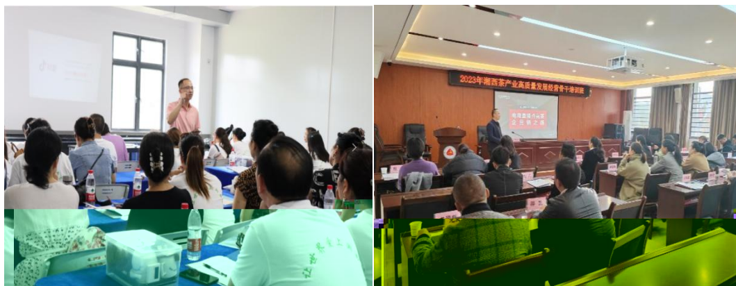
图 企业协助学校为湘西茶企开展电商直播培训

地的合，公不传 电，更关的创创。过大大 供创导，别茶工的操，公 鼓尝、敢创。方供锻 创的，方操的 合。