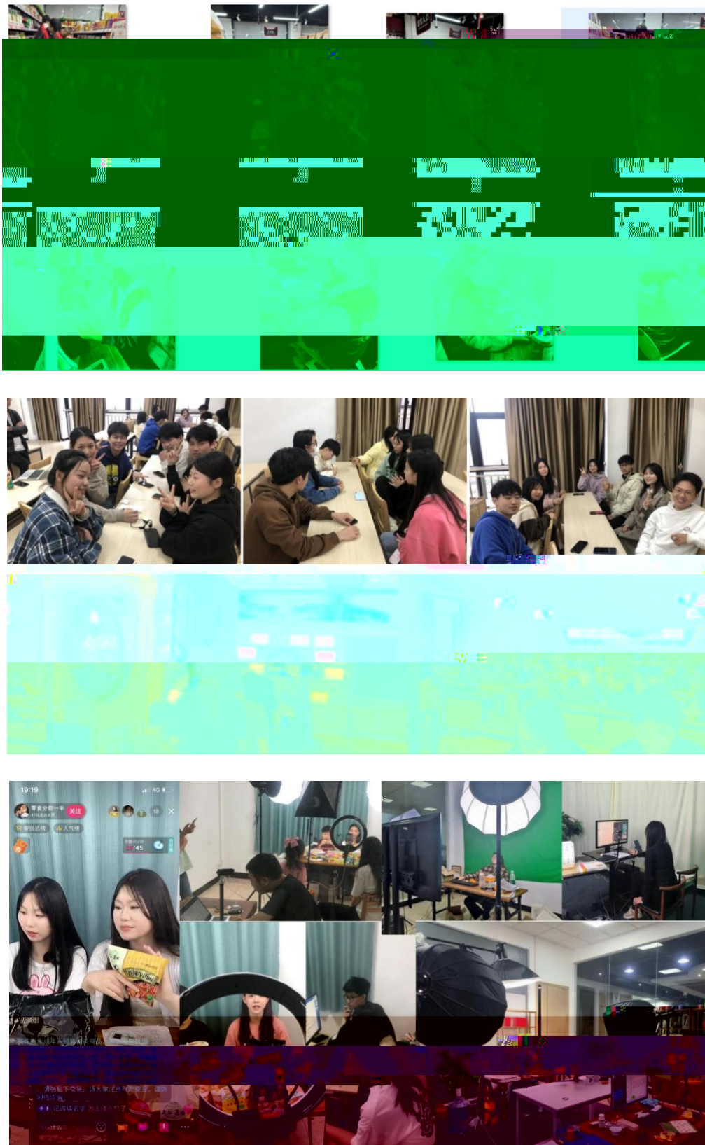
图 组织学生开展实习实训