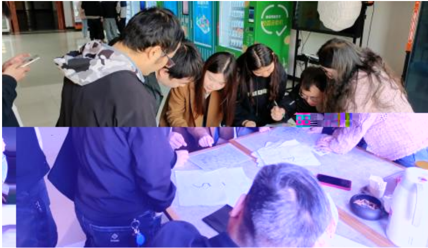
图 卓越团队建设共识营